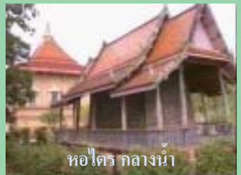
หอไตรกลางน้ำ