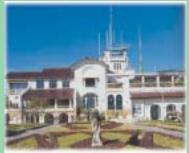
พระราชวังไกลกังวล